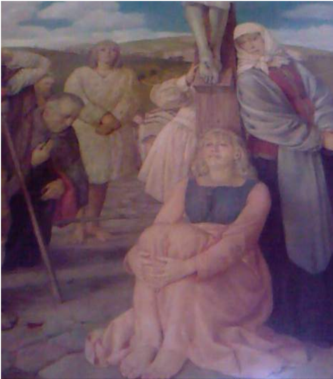
Maria von Magdala weint verzweifelt am Fuß des Kreuzes Bild im Chorraum der Evangelisch-reformierten Kirche Château d' Oex (Waadtland), Schweiz

nach drei Tagen, hat sie erfahren, dass der Tod keine Macht hatte über Jesus, nach drei Tagen, im Garten der Auferstehung! Die Freunde Jesu haben erst allmählich den furchtbaren Tod ihres jungen Anführers verarbeitet und gedeutet. Bereits einer der Zeugen von Jesu Hinrichtung aber erkennt beim Miterleben dieses gewaltsamen Sterbens etwas Erstaunliches, Göttliches „ Wahrlich, dieser ist Gottes Sohn gewesen! “ Dieser Satz aus dem Matthäusevangelium, Kapitel 27, Vers 54 ist das biblische Motto für den Monat April 2015.