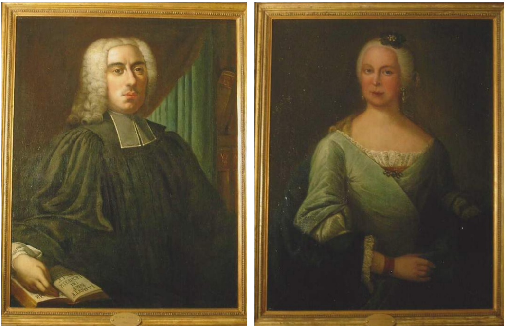
Nachher: "Schaut uns in die Augen" scheinen sie zu sagen. Das aufgefrischte Porträt-Paar der Romagnac's

Staub, Beschädigungen und unsachgemäße Behandlung hatten die beiden Ölgemälde in all den Jahren beeinträchtigt. Auch eine frühere Restaurierung (W. Kesting, 1973) hatte das nicht nachhaltig geändert. Um die Bilder für die nachfolgenden Generationen zu bewahren, hat das Presbyterium die Offenbacher Restauratorin Ines Unger aus der nahegelegenen Karlstraße gebeten, sich der beiden anzunehmen – sie arbeitet hauptberuflich für das Museum Wiesbaden. Sie hat in mühevoller Kleinarbeit die matte Oberfläche der Ölgemälde gereinigt und für mehr Tiefenlicht gesorgt, aufstehende Farbschollen, Blasen, Beschädigungen, Übermalungen, Schlieren, Flecken im Firnis bearbeitet sowie Fehlstellen an den Rahmen repariert. Ablagerungen wurden entfernt, der matte Firnis durch Bedampfen regeneriert und fehlerfarbige Übermalungen retuschiert. Zahlreiche Spenden, auch anlässlich persönlicher Jubiläen, ermöglichten das erst. Der Betrag von 1585,67 € ist auch schon annähernd zusammengekommen. Wer möchte noch zur Vollendung beitragen? Während der Wartezeit auf die Rückkehr der Bilder im November und Dezember verschönerte eine gelungene Photoausstellung von Luis Xulian Briceño-Velasquez den Saal.