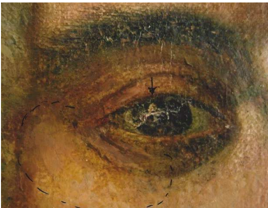
Vorher: Das beschädigte Auge des „Pasteur“