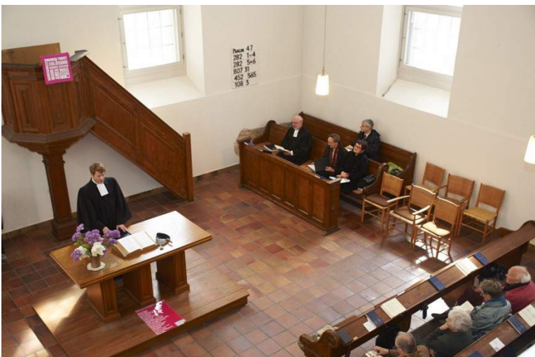
Klarheit und Licht beherrschen den Raum: Gottesdienst in der Französisch Reformierten Kirche

begegnen, gerade in den gering Geschätzten. Wo begreife ich das besser, als in einer Kirche, in der es nichts anderes zu sehen gibt als die Mitmenschen, die neben mir um mich, mir gegenüber in der Kirche sitzen